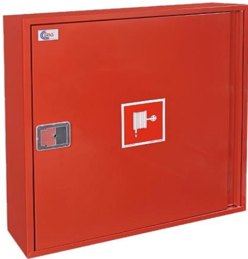
Hydrant wewnętrzny DN25 SLIM GREEN