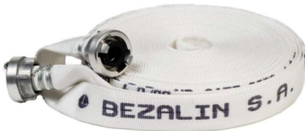
Wąż pożarniczy tłoczny, fi 25 mm, długość 15 mb, łączniki aluminiowe typu STORZ do hydrantów