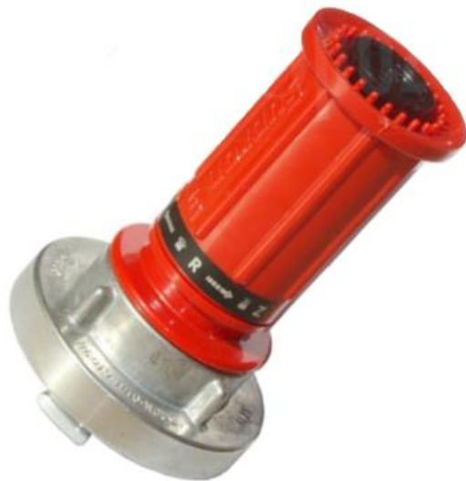
Prądownica wodna hydrantowa typ PW-52. Średnica dyszy 13 mm.