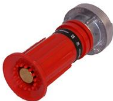
Prądownica hydrantowa 25 z regulacją SP